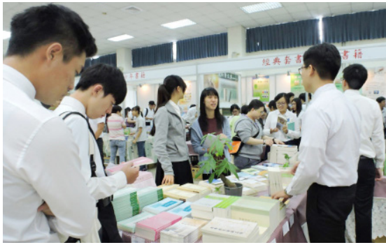
神聖啟示的推廣者

感謝主！已過台灣南區眾召會書報博覽會暨召會生活展覽，吸引了超過一千位弟兄姊妹及福音朋友與會。此次有五個書報攤位，分別是聖經詩歌，經典套書、暢銷書籍，電子產品、影音產品，兒童青少年書籍及福音用品。眾聖徒對書報的渴慕及出代價買真理，實在使我們眾人彼此得着激勵。也願追求真理的風氣，充滿全召會，『對耶和華之榮耀的認識，要充滿遍地，好像水充滿洋海一般。』（哈二 14）以下主要是服事此次書報展的聖徒之分享：