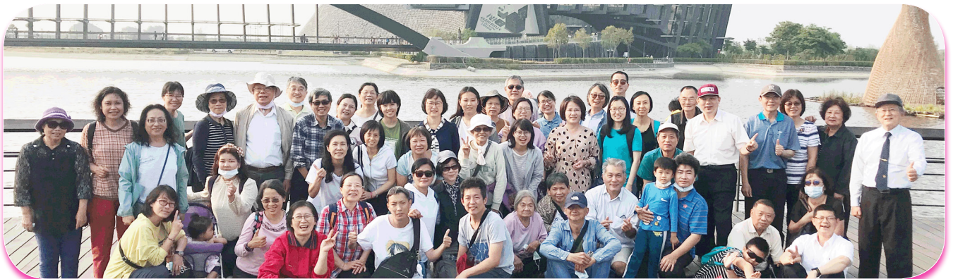
一大區會後前往林初埤、咖啡觀光工廠、故宮南院，因偕同手語聖徒，我們得以一窺故宮南院內歷代的館藏，非常驚豔。

3/20 青年照顧區（一、五、八、十五大區）四個大區事奉相調於關仔嶺統茂會館會議室聚會，共有 200 多位聖徒報名參加，各大區均有活力排輪番作見證，看見主是奮力行動的神：一、活力排同心合意的禱告：姊妹為丈夫得救與同伴禱告二十年，去年底他終於得救了。二、活力排福音出訪：經歷主的軛是輕省的、擔子是容易的。三、家聚會牧養：一位思覺失調的姊妹，在校時常受罷凌而苦不堪言，但因着哥哥在外地得救了，回家把她帶來召會，而接受姊妹們週週的牧養、喫喝主的話，不僅思覺失調情況改善，在校與同學相處，也漸入佳境，生活變得喜樂而積極。這次相調，她的父母也隨她前來相調。四、活力排彼此牧養並一同出訪，不僅個人得扶持、脫離自憐並配搭餵養新人。五、503 區辦相調，共來了八十幾位參加，其中有十九位福音家長，現今仍持續接觸中。相調時，同眾聖徒一同領畧基督的闊長深高，也與其他大區聖徒相調很喜樂，就連年長聖徒都覺得參與相調，格外有活力也不疲累，並且經歷跟隨羊群的腳蹤，許多問題都迎刃而解。阿利路亞，在流中全然蒙福。